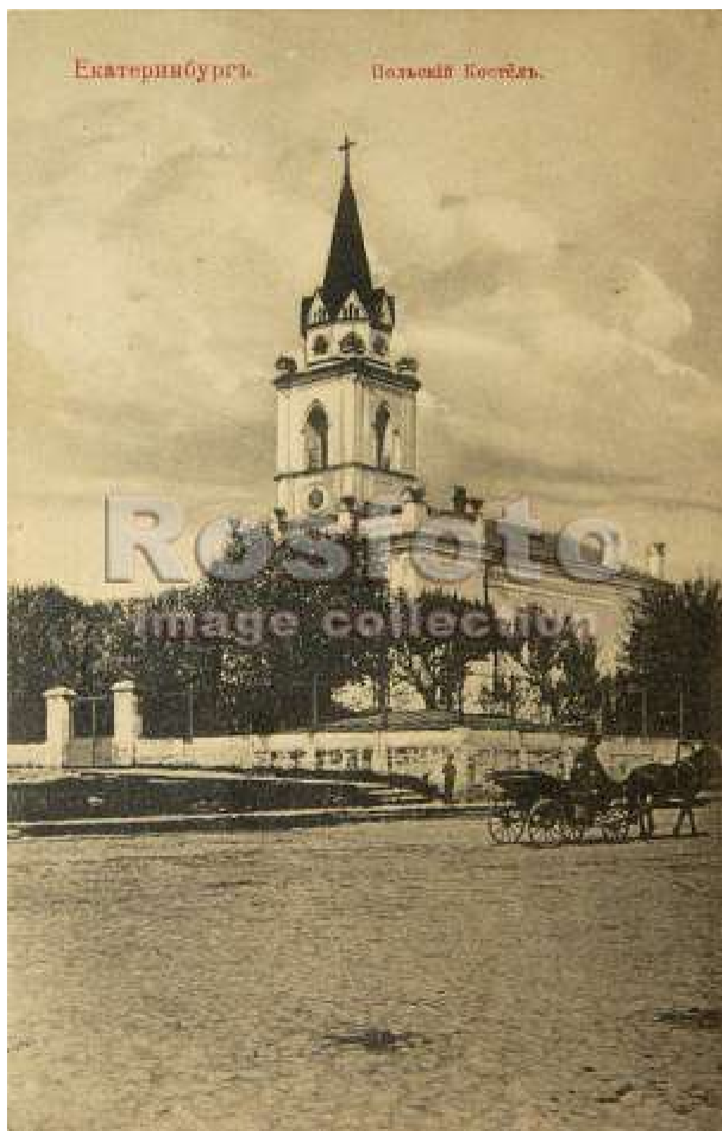
Рисунок 2. Костел Святой Анны. Екатеринбург. 1885 г