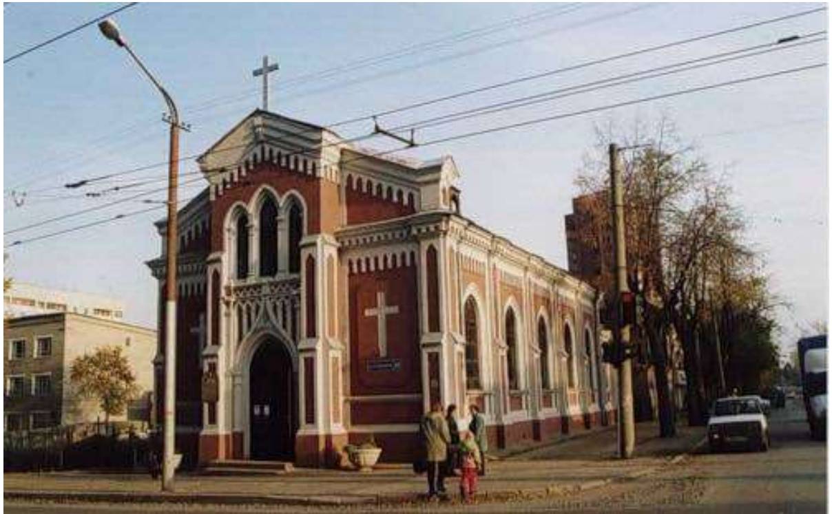
Рисунок 3. Собор непорочного зачатия Девы Марии. Пермь. 1875 г. Архитектор Р.И. Карвовский.