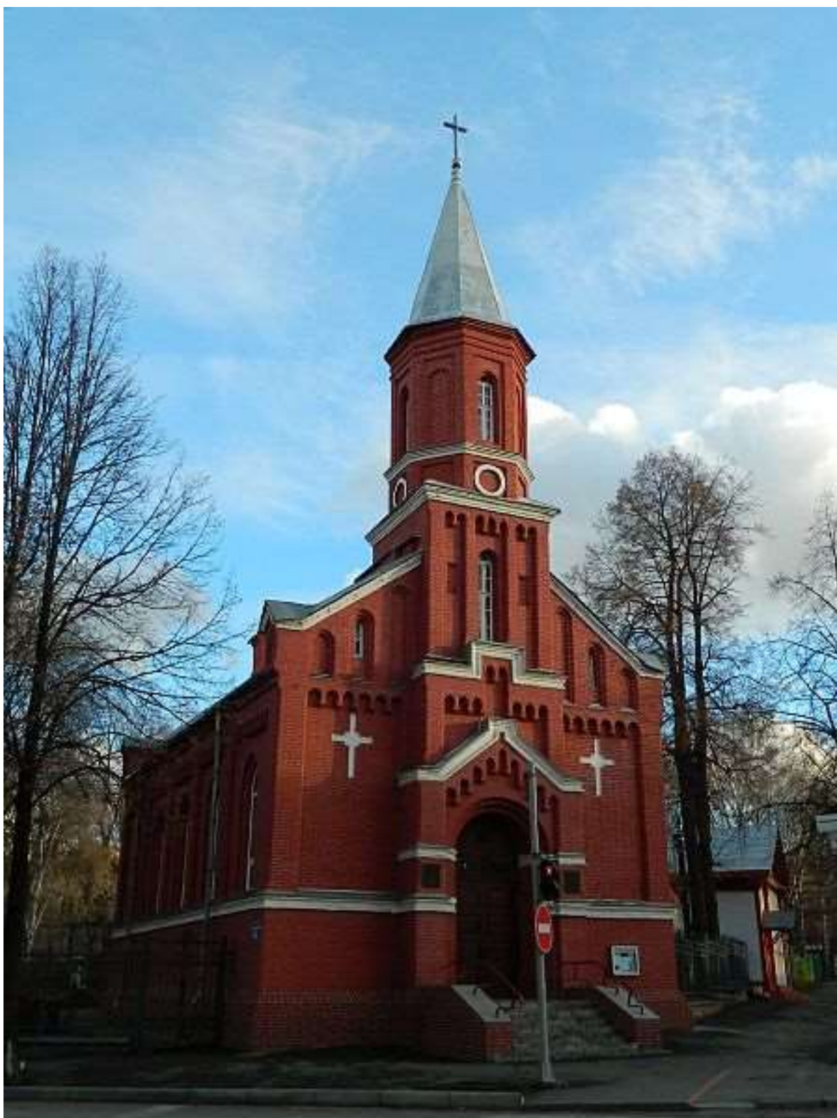
Рисунок 4. Лютеранская кирха. Пермь. 1885 г. Архитектор - Г.Ю. Боссе. Руководитель работ. Р.И. Карвовский