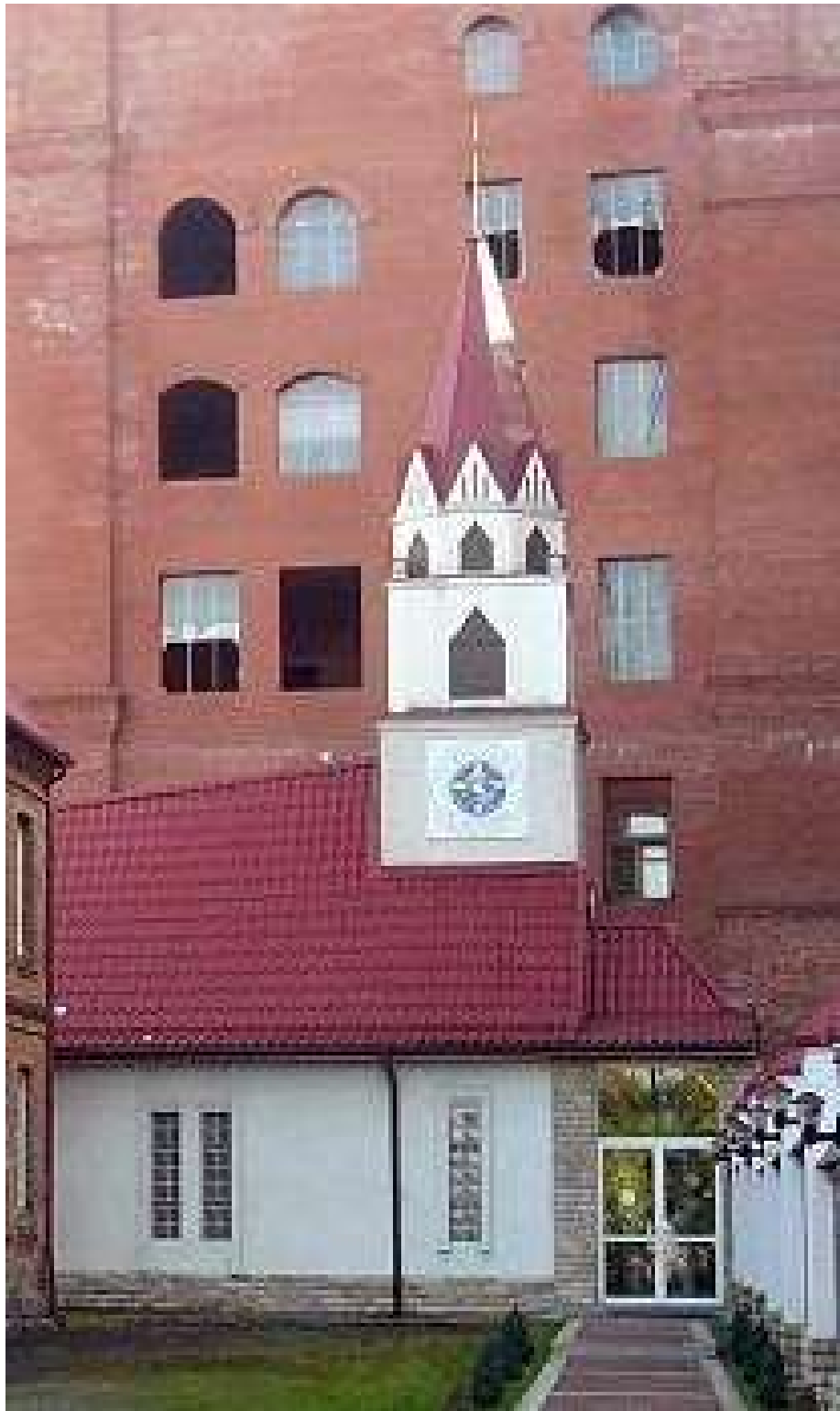
Рисунок 5. Приход Святой Анны. Екатеринбург. 1997 г. Архитектор М. Гольдбик.