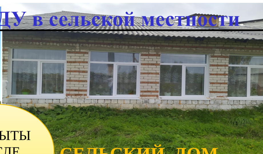
СЕЛЬСКИЙ ДОМ КУЛЬТУРЫ Д. УВАЛ