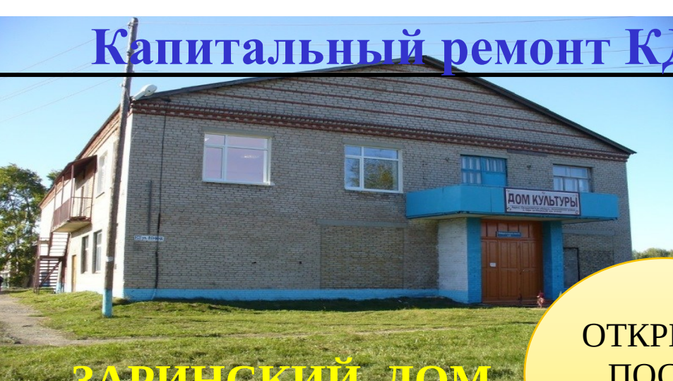
ЗАРИНСКИЙ ДОМ КУЛЬТУРЫ